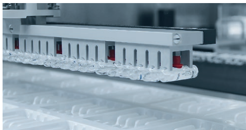
Li-Pro下料器将安瓿瓶轻轻放入已成型的泡眼中。